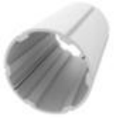
Alumínium körprofil 89 mm átmérő